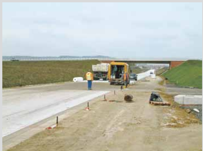
Geotextil auf hydraulisch gebundener Tragschicht (HGT)