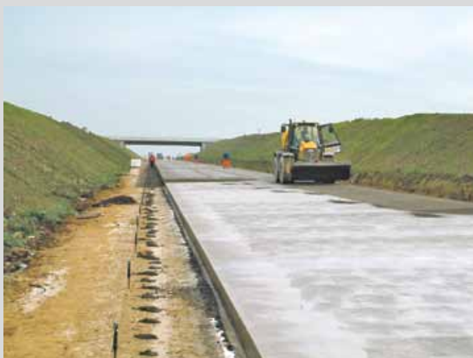
Ausbürsten zur Waschbetonoberfläche