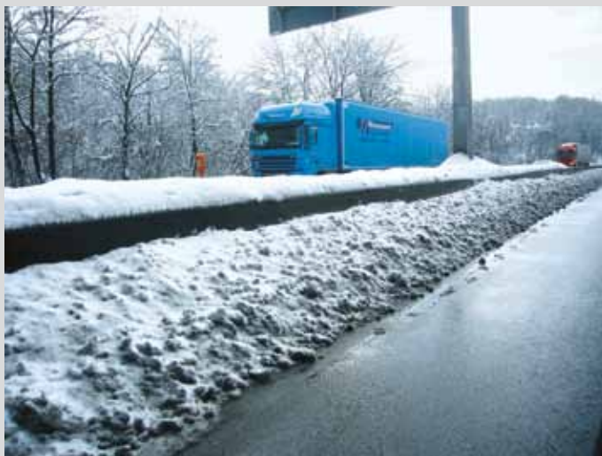
Bild 12: Schneebedeckte Betonschutzwand im Mittelstreifen auf der A 46