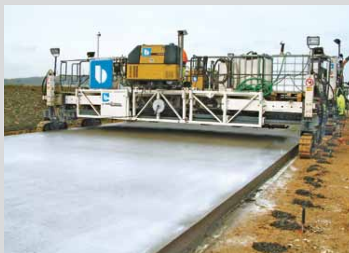
Aufsprühen eines flüssigen Nachbehandlungsmittels