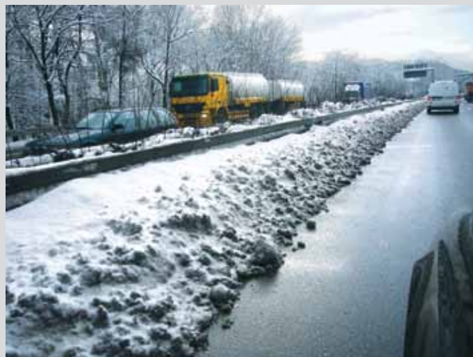
Bild 13: Schneebedeckte Stahlschutzplanke im Mittelstreifen auf der A 46