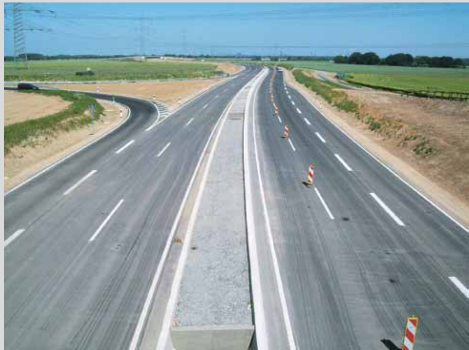
Bild 11: Mittelstreifen, der nicht zur Bepflanzung vorgesehen ist