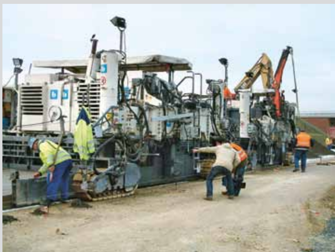
Fertigerzug im Einsatz

netz gebaut werden. Das Land Hessen hatte sich früh dafür entschieden, Fahrbahn inklusive Erdbau als Pilotprojekt für einen Funktionsbauvertrag auszuführen. Wie bei einem klassischen Public-Private-Partnership- (PPP-) Projekt übernimmt der Auftragnehmer sowohl den Bau des Objekts als auch dessen Instandhaltung über einen vertraglich vereinbarten Zeitraum. Der Unterschied besteht in der Beschreibung der geschuldeten Leistung. In einem klassischen Bauvertrag wird die geschuldete Qualität durch die Beschreibung der verwendeten Materialien und der Bautechnik definiert. Der Funktionsbauvertrag löst sich von diesen technischen Anforderungen und hat lediglich die Befahrbarkeit (Funktion) der Straße über einen längeren Zeitraum – bei der Ortsumgehung Friedberg sind dies 30 Jahre – zum Inhalt. Die Befahrbarkeit wird im Wesentlichen gekennzeichnet durch Zustands- und Schadensmerkmale wie Quer- und Längsebenheit,