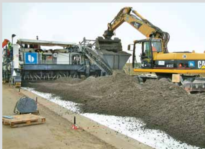
Unterbeton auf hydraulisch gebundener Tragschicht (HGT)