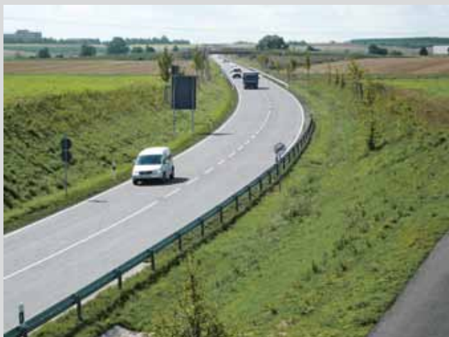
Alle Bilder: Endresultat B 3