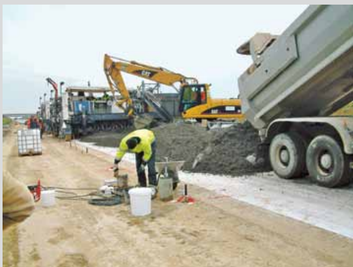
Prüfung des Unterbetons

Die kontinuierliche, störungsfreie Belieferung der Baustelle mit gleichmäßigen Betoneigenschaften aus drei unterschiedlichen Transportbetonwerken hatte dabei oberste Priorität. Der angelieferte Beton (Oberbeton: Gesteinskörnungen 0/2, 5/8, LP, CEM I 42,5 N; Unterbeton: Gesteinskörnungen 0/2, 2/8, 8/16, 16/22, LP, CEM I 42,5 N) wurde während des Einbaus fortlaufend geprüft, um eine gleichbleibend gute Qualität zu gewährleisten. Dies galt insbesondere für die Ausgangsstoffe, die Konsistenz und den Gehalt an Mikroluftporen im frischen Beton – einer wichtigen Kenngröße für den Frost- und Tausalz widerstand eines Straßenbetons.