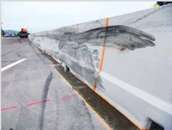
Bild 9: Geringfügige Verschiebung der Betonschutzwand mit besonders hohem Aufhaltevermögen

Sowohl an den Seitenstreifen als auch – und insbesondere – im Mittelstreifen lassen sich durch den Einsatz von Betonschutzwänden bei der Bankettpflege und beim Grünschnitt z.T. deutlich Kosten einsparen. Bedingt durch die geschlossene Bauweise sammelt sich an den Banketten kein Unrat an und die Bankette können nicht «hochwachsen», sodass ein regelmäßiger Bankettabtrag mit Entsorgung des belasteten Materials entfällt [6]. Anfallender Schmutz kann durch Abkehren einfach entfernt werden. Bei zweiseitiger Schutzeinrichtung aus Beton im Mittelstreifen ist ein Grünschnitt seltener und einfacher durchzuführen. Bei nicht bepflanzten Zwischenräumen entfällt der Grünschnitt vollständig (Bild 11).